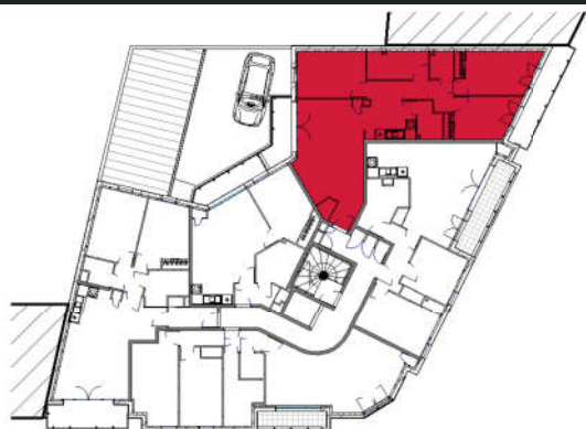
Plan de situation